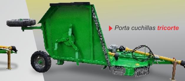
▶ Porta cuchillas tricorte