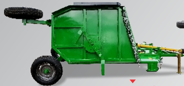
Porta cuchillas clásico